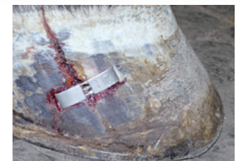
DEZEMBER 2005 // durchdringender, blutender Hornspalt

> Und daher wird ATCOM HUF-VITAL® seit vielen Jahren erfolgreich als Ergänzungsfutter zur Verbesserung der Hornqualität und des Hornwachstums eingesetzt. Es wird zudem ständig entsprechend der jeweils neuesten Ernährungserkenntnisse weiterentwickelt.